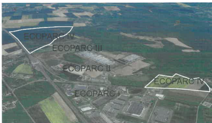
Vue d'ensemble des ECOPARC

D'une superficie totale de 88 hectares, l'ECOPARC IV est situé sur deux secteurs, une zone de 15 hectares (secteur Nord), à l'arrière d'ECOPARC II, sur la commune de VIRONVAY et une zone de 73 hectares (secteur Sud) en prolongement d'ECOPARC III sur les communes d'HEUDEBOUVILLE et de FONTAINE-BELLENGER.