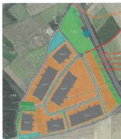
2 bassins (en bleu sur le schéma)

Il y aura un bassin en limite d'ECOPARC III qui se videra via une canalisation en servitude sur la parcelle adjacente au nord. Le second bassin sera à l'angle de la route d'Ingremare et de rue de Marinette.