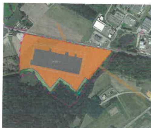
Plan d'aménagement - 15 hectares secteur Nord (VIRONVAY)

Les futures activités qui s'installeront sur ECOPARC IV sont des activités tertiaires, commerciales, industrielles ou de logistique. Pour cela, le projet prévoit la création de bâtiments d'une superficie de 18 000 m 2 et de 36 000 m 2 .