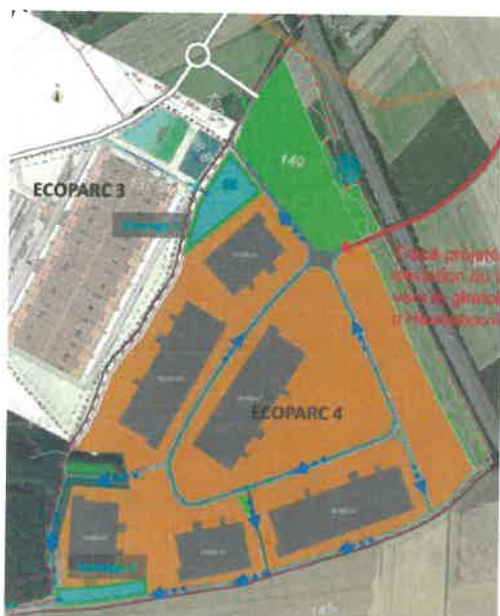
Plan d'aménagement - 73 hectares Secteur Sud (HEUDEBOUVILLE et FONTAINE-BELLENGER)